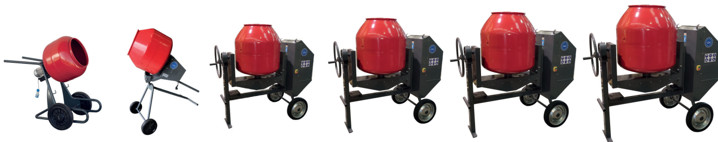
Camac Silenciosa M86